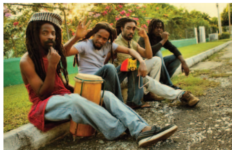
Spannende Touren mit spontanen Begegnungen. Hier erleben Sie das „echte“ Jamaika.