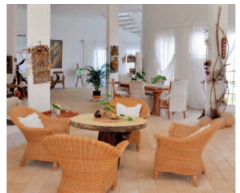
Im Living Room stehen Ihnen Sitzmöglichkeiten zum relaxen oder zum Essen zur Verfügung.