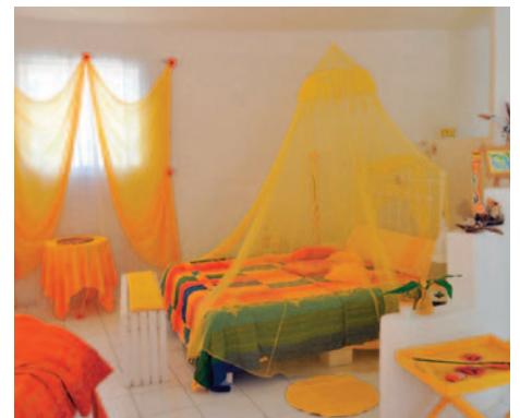
Die Gäste Suiten der Villa Tropical sind individuell und künstlerisch ausgestattet.