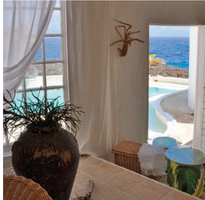
Mit Trauemaussicht auf das karibische Meer. Die Villa Tropical ist geräumig, sowie individuell und stilvoll eingerichtet.