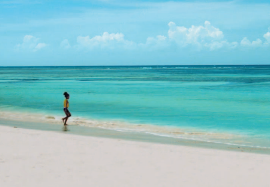
Unvergessliche Eindrücke für Individualisten. Genießen Sie das Flair der Karibik.