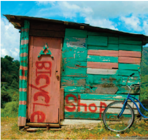
Sportliche Aktivitäten, wie Wandern, Radtouren und Wassersport kommen nicht zu kurz.