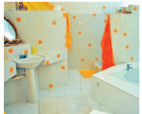
Bettwäsche, Handtücher, Duschtücher oder Waschmaschine. Alles vorhanden.